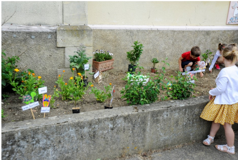
L'école de Saint-Mont

En partenariat avec les DDEN, l'OCCE soutient toutes les classes qui s'inscrivent dans ce projet, dans le but d'embellir leur cour de récréation, mais pas seulement.