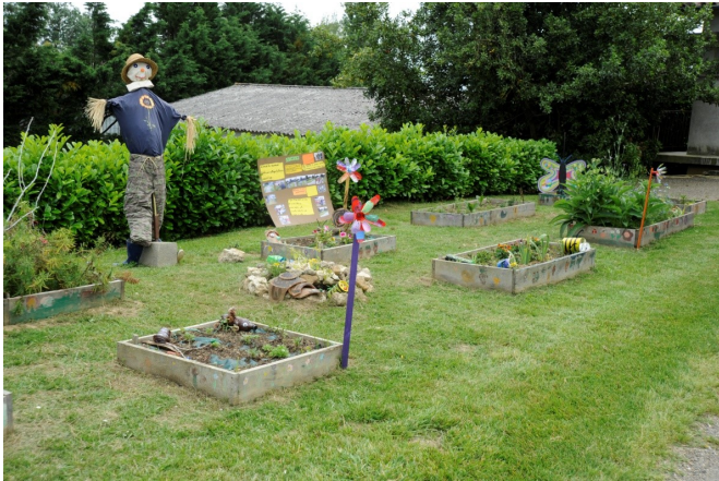
Photos école Lannepax - juin 2021